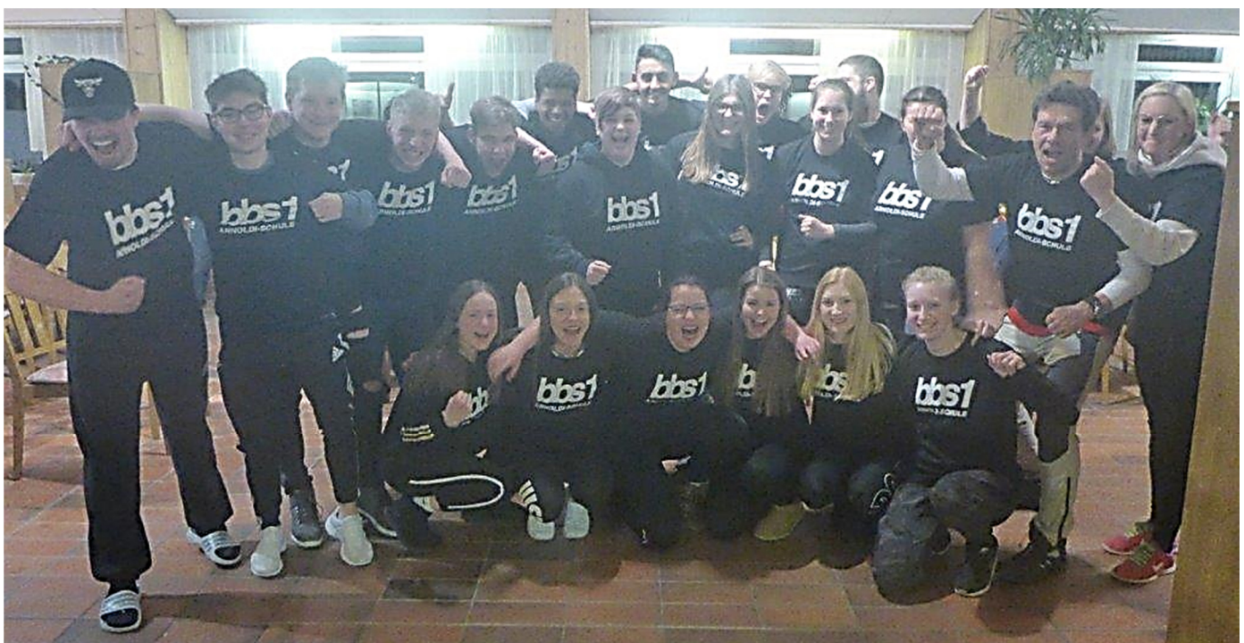
Die G 171 freut sich über den Sieg und die Champion-Shirts